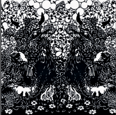
Bruno Weber Papier- und Metallschnitte

Als Kreativer will ich die menschlichen Denk- und Vorstellungsmöglichkeiten sprengen, das Wunderbare der diesseitigen Welt und die erhaschten Blicke in die jenseitige Welt festhalten. Die Reduktion auf das reine Schwarz und Weiss ist eine Einschränkung, die mich im positiven Sinn herausfordert. Wie im Leben gilt, wenn ich das Dunkel nicht stehen lassen kann, verliert die Helligkeit ihre Kraft. www.papierschnitt.ch